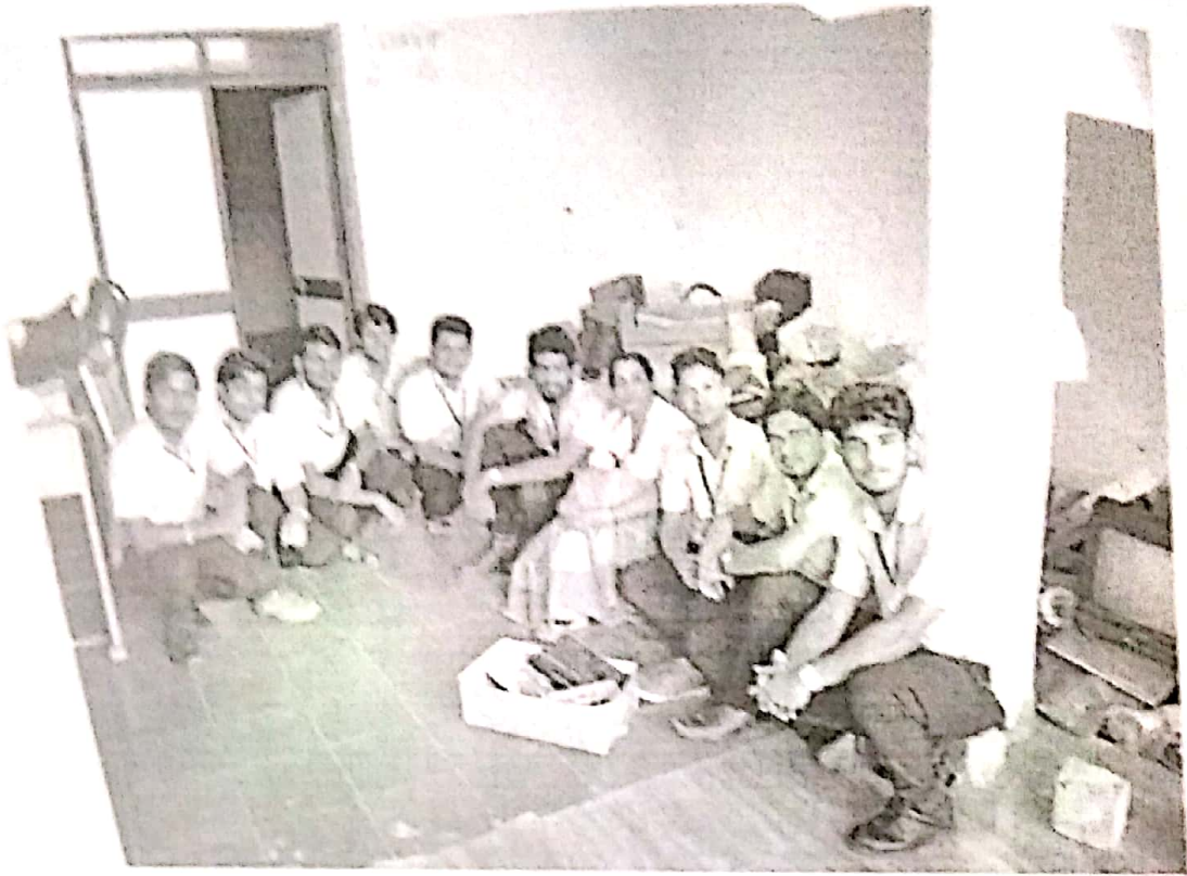
The e-waste collection team along with the IEEE SIMAT Student Branch Counselor