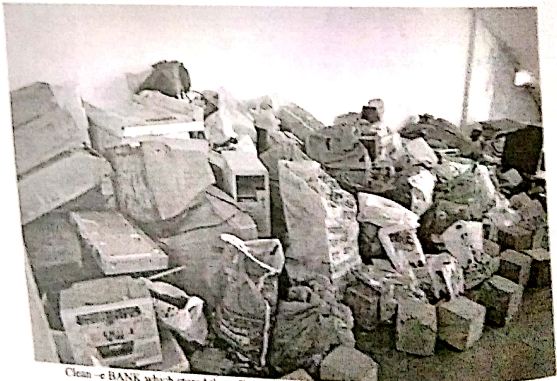
Clean-e BANK which stored the collected e-waste, situated near the SIMAT Chemistry Lab