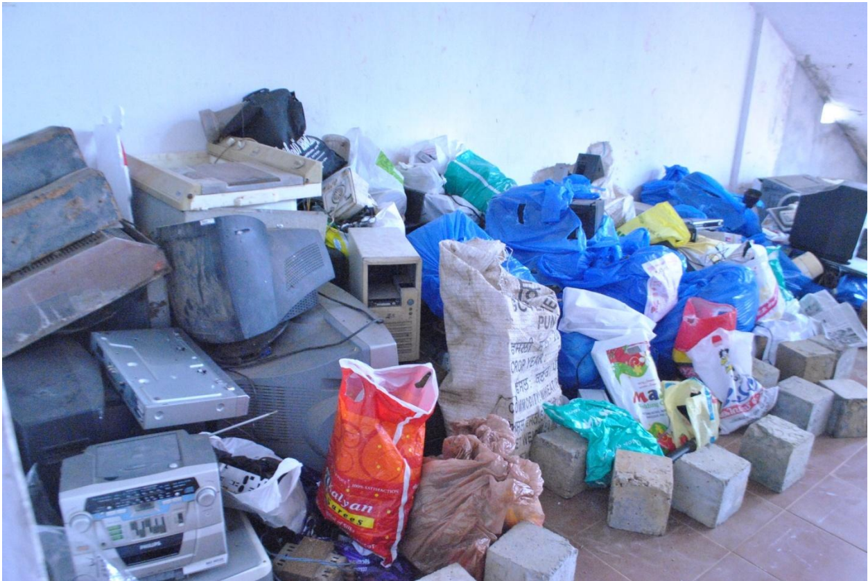
Clean –e BANK which stored the collected e-waste, situated near the SIMAT Chemistry Lab