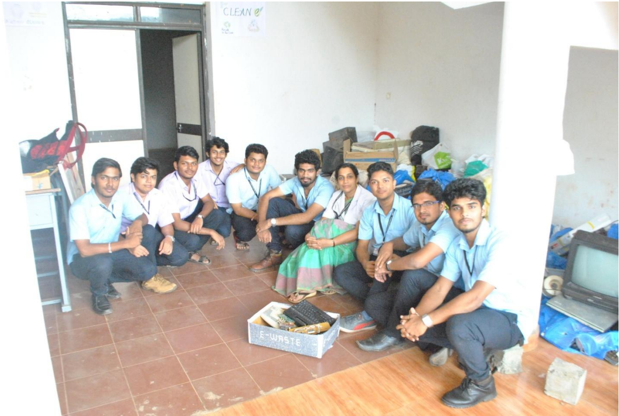
The e-waste collection team along with the IEEE SIMAT Student Branch Counselor